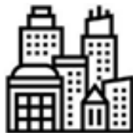
Canet de Mar